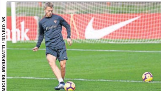
MIGUEL MORENATTI / DIARIO AS